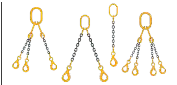
Традиционная система — 10 ветвей на 4 разных стропах.

Уникальные особенности изделий GrabiQ позволили компании Gunnebo Lifting создать грузоподъемные системы более удобными. GrabiQ FlexiLeg представляет собой удобное решение для моментального выбора количества ветвей, в котором одна основная петля в сочетании с пятью ветвями заменяют десять ветвей, используемых в традиционной системе.